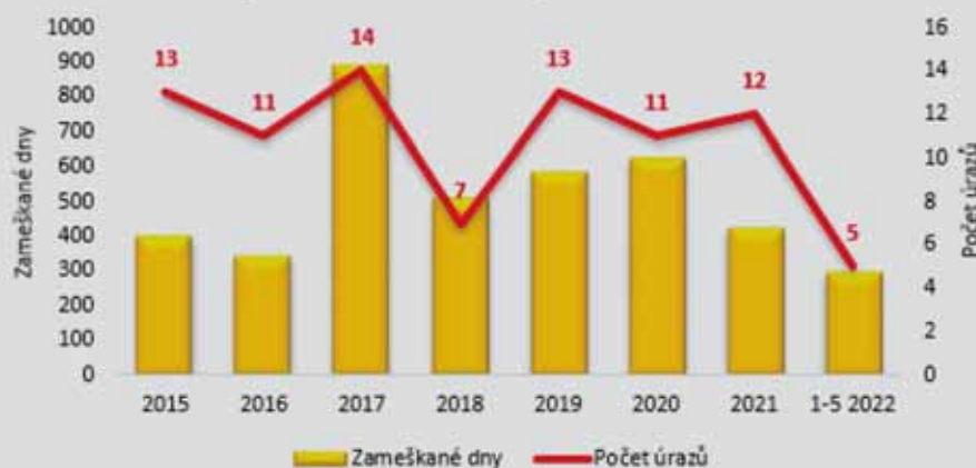
Úrazy a zameškané dny 2015 až 5/2022