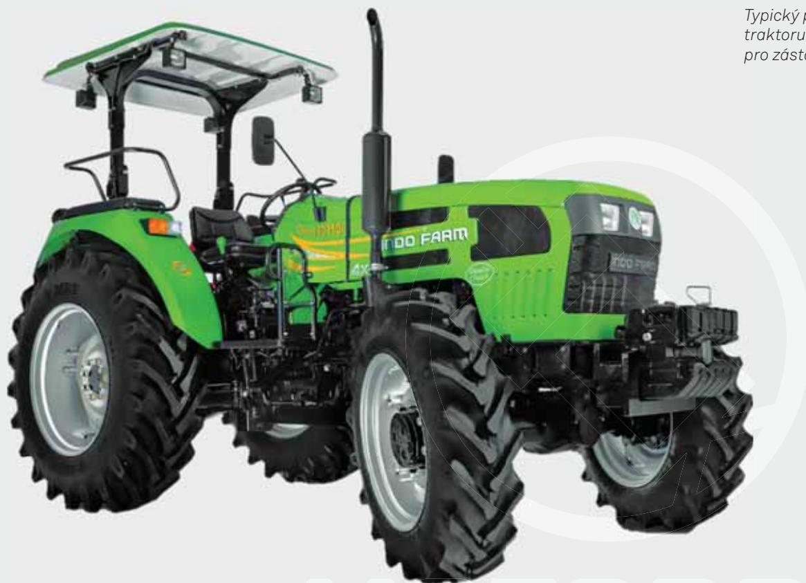
Typický představitel traktoru IndoFarm pro zástavbu motorů

„V současnosti máme již ukončen vývoj výkonové verze 55 kW a zároveň se provádí optimalizace druhé výkonové verze - 45 kW. Motor s výkonem 55 kW je již připraven včetně veškerého příslušenství k expedici k zákazníkovi. Brzy to samé po ukončení prací čeká i druhou výkonově slabší verzi. Homologace obou motorů je naplánována na srpen tohoto roku za naší účasti. Po úspěšném zakončení homologačních zkoušek bude následovat příprava sériové výroby,“ dodává k dokončení významného vývojového projektu p. Štěpánek.