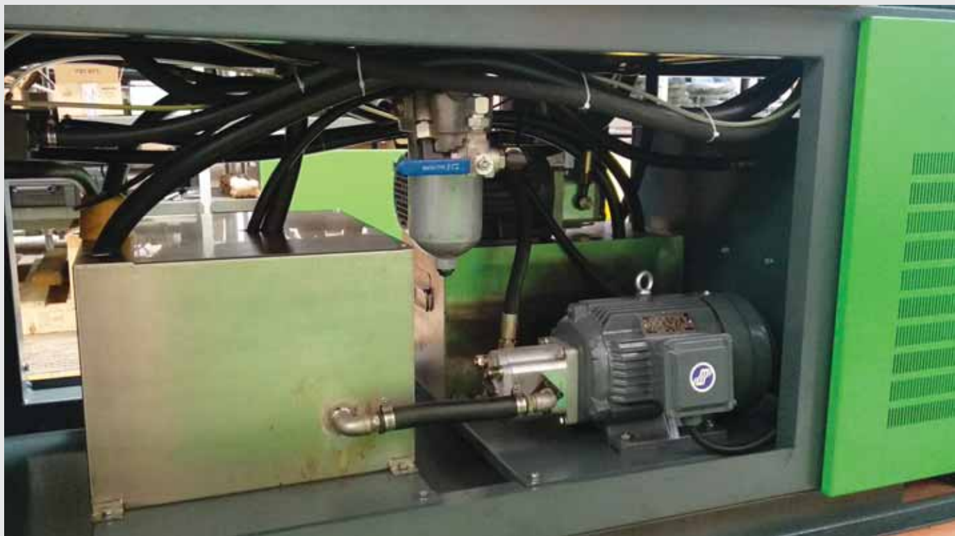
Palivová nádrž s podávacím čerpadlem a filtrační patrony