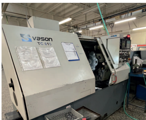
Soustruh VASON TC 615

V souvislosti s přesunem výroby do Jihlavy bylo nutné řešit prostor, kde budeme skladovat písty a válce. Volné kapacity skladu ve Výrobě 1 byly minimální a proto jsme museli hledat efektivní způsob skladování pro cca 1 500 paletek. Situaci jsme vyřešili obstaráním výtahového skladovacího zařízení GonvaLift , které zabere pouze 14 m 2 plochy. Skladovací věž o výšce 8 metrů pojme 60 polic, přičemž každá má nosnost 500 kg. Zařízení je navíc napojené na náš informační systém, takže nám přináší kromě úspory plochy i úsporu času při pořizování dat do informačního systému během naskladňování či vyskladňování dílů. Výše investice byla 1,6 milionů Kč.