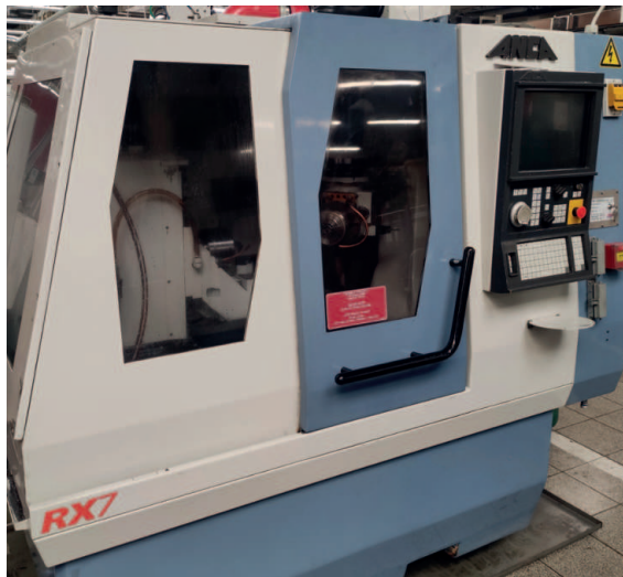
Bruska ANCA RX7

V dubnu jsme převzali repasovanou brusku ANCA RX7 , kterou nám repasoval a dodal přímo výrobce. Jedná se o stroj s automatickým nakládáním dílů, který doplní naše stávající tři stroje stejného výrobce. Zařízení slouží k finálnímu broušení pístů a jeho pořízením zvýšíme naši kapacitu a stabilitu výroby. Cena repasovaného stroje byla 4,9 milionů Kč, tzn. cca 50% ceny stroje nového.