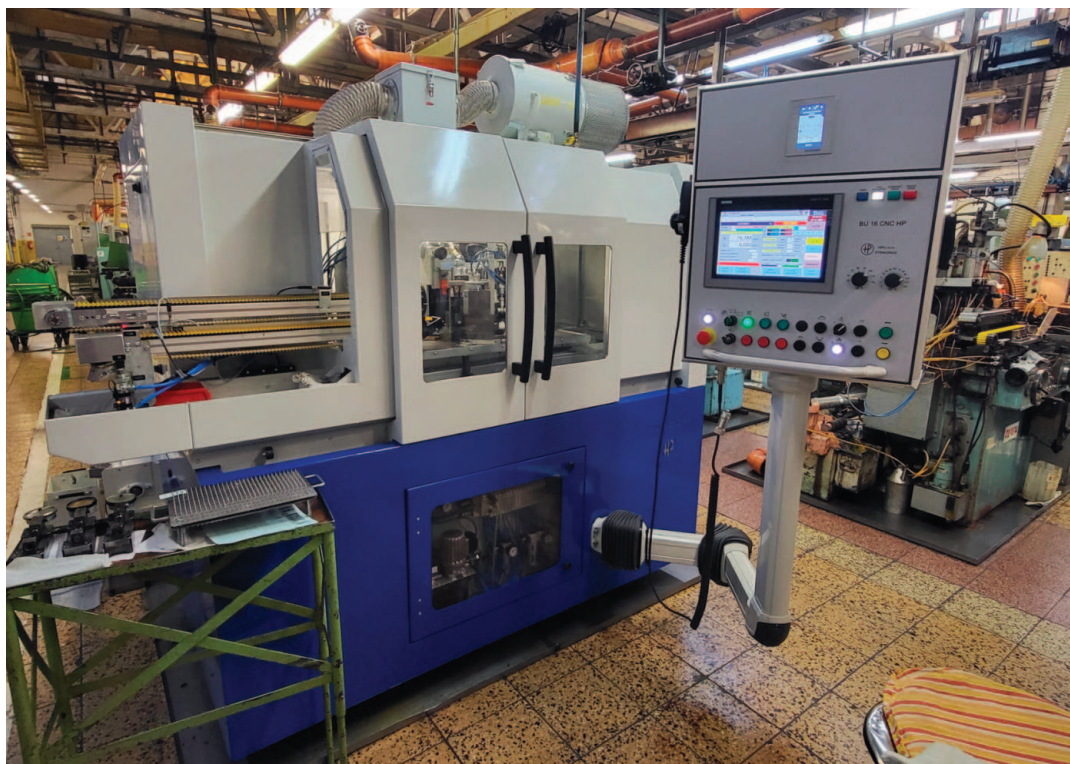
Bruska BU 16 CNC HP

V létě byla na Výrobě 2 instalována modernizovaná bruska BU 16 CNC HP (původní BU 16/Rc810), která se používá pro hrubování konce jehly. Jednalo se o náročnou modernizaci po stránce technické i časové. Vlastnímu objednání stroje předcházela řada technických jednání našich techniků s vybraným dodavatelem. Klíčové bylo nalézt spolehlivé konstrukční řešení nakládání a upínání jehel, které bude vyhovovat našim požadavkům po stránce funkčnosti, spolehlivosti a požadované přesnosti. Během zkušebního provozu dodavatel odstranil různé nedostatky a nyní je stroj již v sériovém provozu. Přínosem je také výrazně vyšší výkon stroje oproti těm původním. Náklady na modernizaci dosáhly 4,9 milionů Kč.