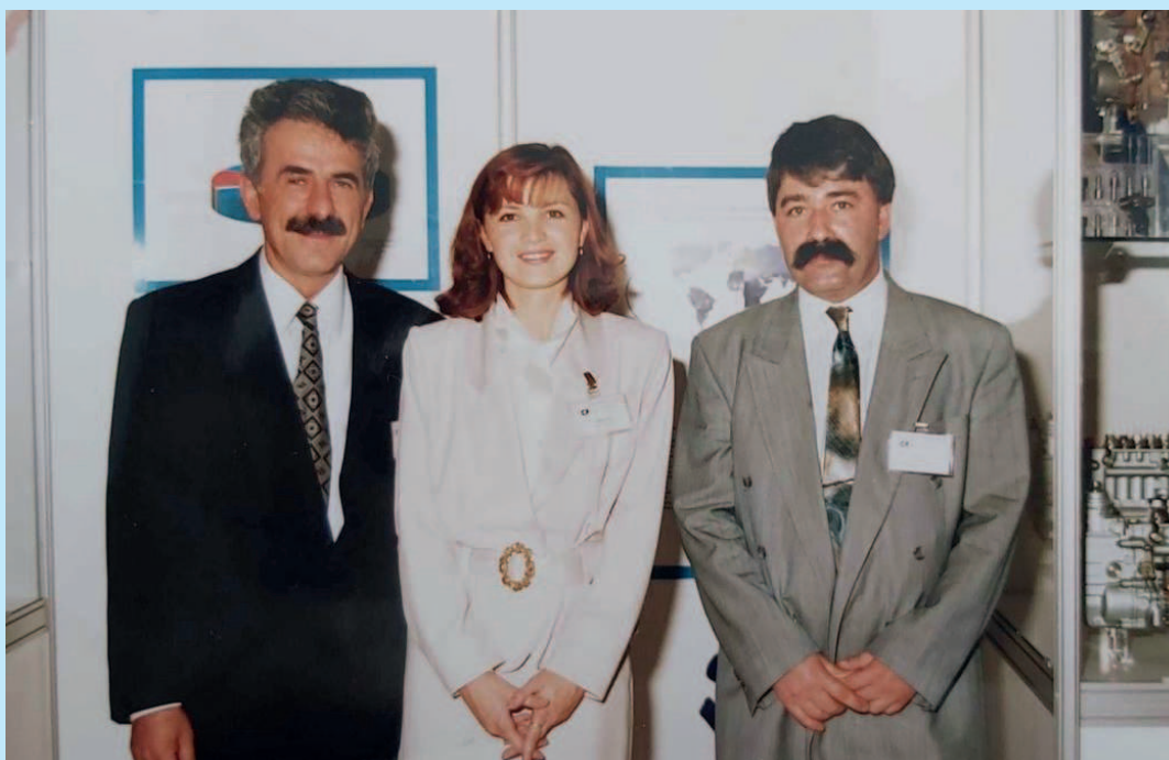
Oslavy výročí 50 let v MOTORPALu