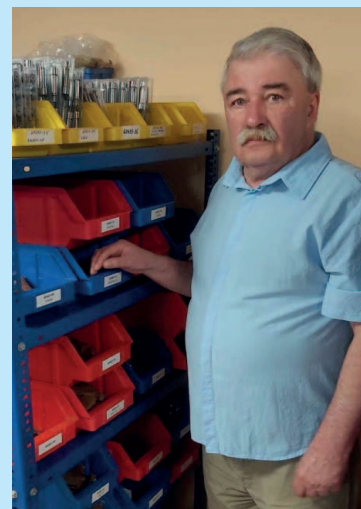
Sklad firmy POL-EURO v Kielczach

Já se starám v současnosti o to, aby servisy MOTORPALu v Polsku fungovaly. Koordinuji celou servisní síť a prodej náhradních dílů. Když zaměstnanci OTS cokoli potřebují, mají nějaký dotaz nebo chtějí zjistit funkčnost konkrétního servisu, nemusí jezdit do Polska. Mohou se obrátit na mne a jsem jim vždy rád k dispozici. A nyní se mohu pyšnit i tím, že konečně budu zveřejněn v TRYSCE! (směje se).