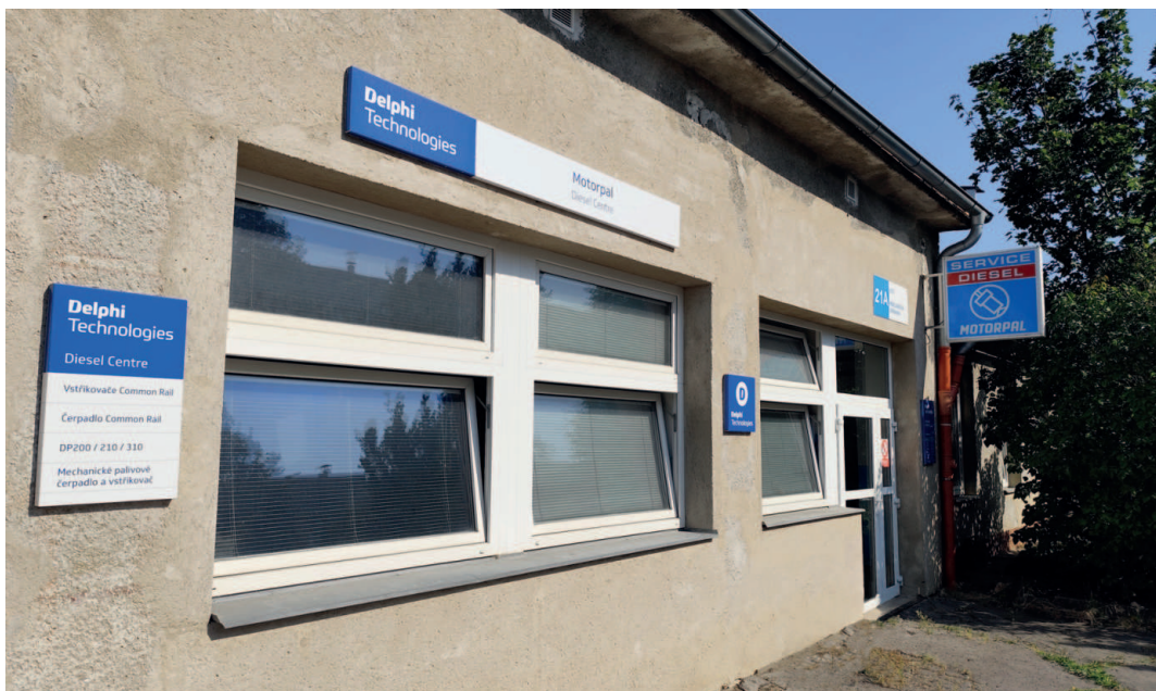
Servisní středisko MOTORPALu v jihlavském areálu

Budoucnost našeho Servisního střediska vidím zatím dobře. Starší i nové zemědělské, stavební, dopravní a jiné stroje, které využívají naše produkty, budou určitě ještě chvíli v provozu a nové technologie se jich zatím nebudou týkat tak úzce, jako v osobní dopravě. A budoucnost MOTORPALu? Se svou náplní, kterou má a chystá, bude ještě nějakou dobu určitě fungovat.